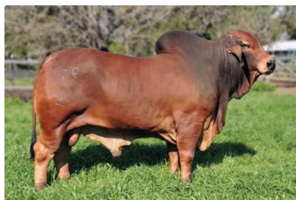
Inferral, su padre.