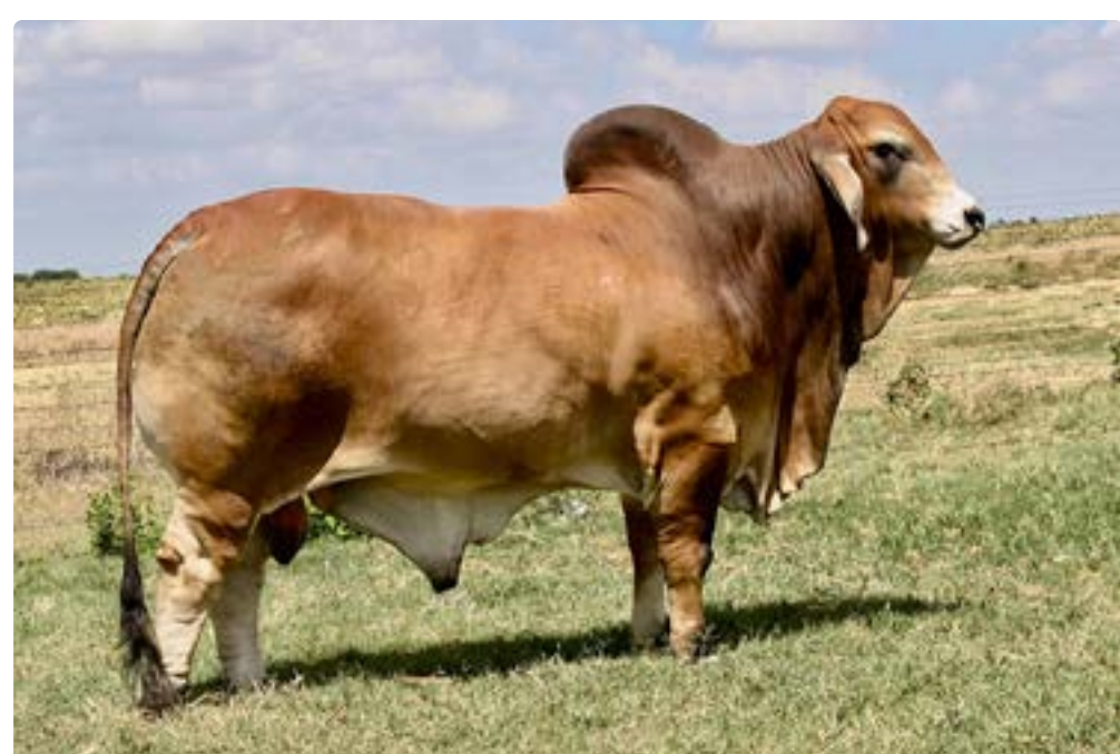
LMC LN Polled Pappo, su padre.